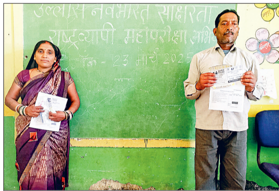
हरिभूमि न्यूज | बेमेतरा

उल्लास साक्षरता परीक्षा अभियान जिले में प्रशासनिक व शिक्षा विभाग की देखरेख में रविवार सफलता पूर्वक आयोजित की गई। इस महापरीक्षा में शामिल होने जोर-शोर से अभियान चलाया गया। पूरे जिले के ग्रामीण क्षेत्रों के 6567 महिला-पुरुष उल्लास साक्षरता परीक्षा अभियान में शामिल हुए। परीक्षा देने वाले महिला पुरुषों को शिक्षा विभाग ने प्रमाण पत्र प्रदान किया। इसके अलावा इस परीक्षा अभियान में रोमांचकारी माहौल भी देखने मिला।